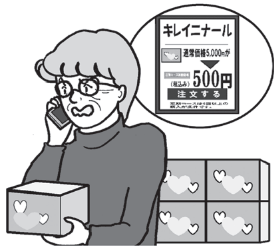
イラスト 鈴木 薫

スマートフォンで健康食品の広告を見つけた。定価5000円のところを初回500円と書かれていたので、1回だけのつもりで申し込んだ。1回目の商品が届いてから1か月後にまた商品が届き、定期購入割引価格の3500円の請求書が同封されていた。驚いて販売サイトに連絡すると、定期購入の契約を結んでいると言われた。広告を見直すと、確かに2回目以降の金額も書かれていて、4回受け取ってからでないと解約できないとも書かれていた。何とかならないのか。