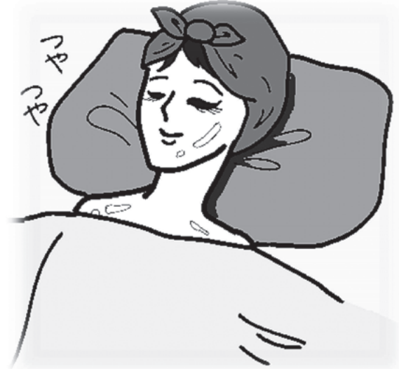
イラスト 鈴木 薫

タウン誌で美顔エステが1000円で体験できるという広告を見つけ、エステサロンに行った。初めに肌の診断をして施術を受けた。体験後、店員から「お肌の状態は良くないです。早く対策しなければ、顔中にシミやシワが出来て大変なことになりますよ。」と言われた。店員の言葉で不安になり、言われるがまま6ヶ月間の美顔エステコースの契約をし、効果を上げるためにと勧められた化粧品も購入して合計50万円をクレジット払いにした。その後も次々と契約を勧められ、支払いができなくなった。解約したい。