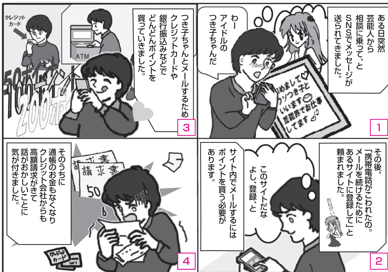
イラスト 鈴木 薫

芸能人やマネージャーを名乗るメールだけでなく、知らない人からのメールには注意しましょう。他にサイトへ誘導する手口には、 副業や仕事を紹介する というもの、 話し相手になってくれば遺産を渡す というもの等があります。最近では、 占いサイトに登録して、結果を聞くためにその都度ポイントを購入する 、というものがあります。