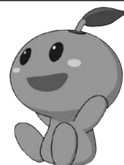
和歌山県食育キャラクター みかぼう

http://www.pref.wakayama.lg.jp/prefg/070300/syokuiku1/index_1.html