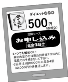
イラスト 鈴木 薫

新型コロナの感染拡大を受け、通販の利用が増えています。通販では、派手な広告に目が行きがちですが、しっかり契約内容を確認しないと知らぬトラブルにあうことも。ふたつの事例を紹介します。