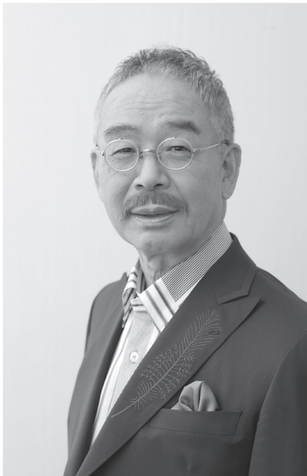
フリーアナウンサー 角 淳一氏