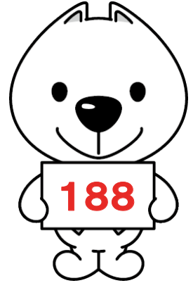
和歌山県 PR キャラクター 「きいちゃん」